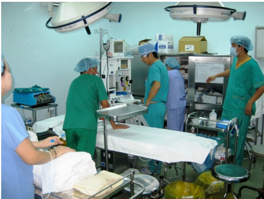
Salle de soins

Le service est composé d'une salle d'attente qui se situe à l'extérieur, au niveau du parking des motos, de deux vestiaires exigus utilisés à la fois par les praticiens, les infirmières, les aides-soignantes et par les patients. Les patients se changent, et vont se placer en face de la salle soins où ils sont affiliés. Trois salles de soins composent le service communiquant par des portes battantes. Deux salles de soins comprennent deux lits sans aucune séparation, et la troisième comprend un seul lit. Tous les matins le planning de la journée est affiché dans le couloir où les patients peuvent voir leur ordre de passage.