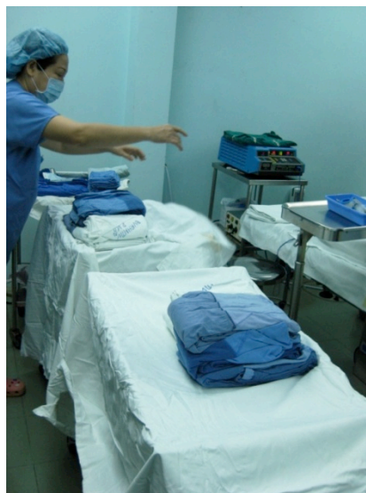
Aide soignante préparant la salle de soins

Pour éviter de salir le matelas de chaque lit l'infirmière mais entre deux jeux de draps des sacs plastiques en guise de protection.