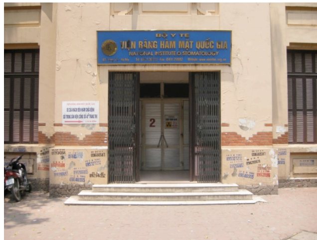
Entrée du service d'odonstomatologie

Le service d'odonstomatologie est organisé de la façon suivante. Chaque discipline de l'odontologie (OCE, prothèse, pédodontie...) correspond à une salle du service. Chacune ayant sa propre salle d'attente correspondant au couloir, et les patients sont adressés aux différents services suivant les soins nécessaires.